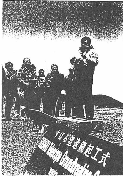
すばる起工式風景 (すばるコーナー参照)