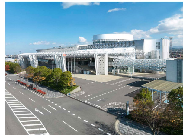
2023年開催のAPRIMの会場となる「ビッグハレットふくしま」。